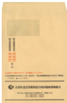
受診券送付用封筒