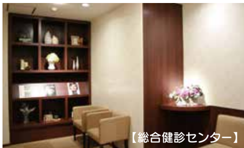
【総合健診センター】