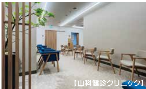
【山科健診クリニック】