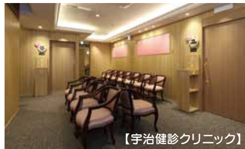
【宇治健診クリニック】